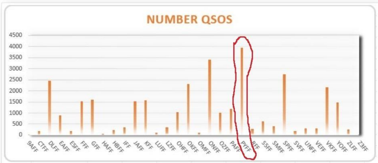
WWFF 10th Anniversary Statistics