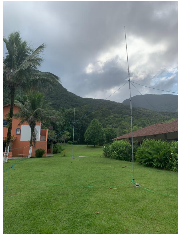
(Montagem e desmontagem das antenas)